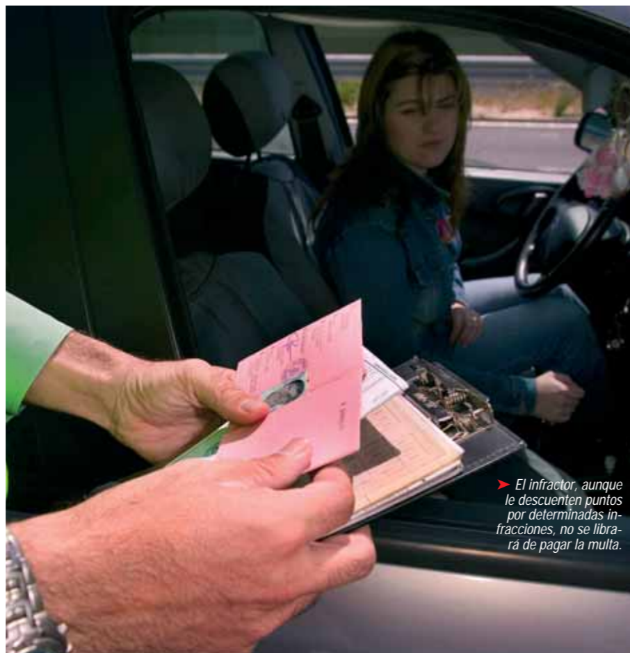
El infractor, aunque le descuenten puntos por determinadas infracciones, no se librará de pagar la multa.

Como regla general, no se pueden perder más de ocho puntos en un día, salvo que entre las infracciones que se hayan cometido figure alguna de la siguientes, consideradas como muy graves: conducir con tasas de alcohol no permitidas, o bajo los efectos de otras drogas, estupefacientes o similares; negarse a someterse a las pruebas de alcohol y drogas; sobrepasar en más del 50 % la velocidad autorizada; la conducción manifiestamente temeraria; la ocupación excesiva del vehículo; circular en sentido contrario al establecido; hacer carreras no autorizadas y el incumplimiento (más del 50%) de los tiempos de conducción y descanso).